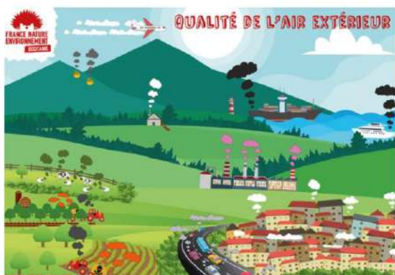
2 bâches ignifugées (2x2,5m) pour un espace extérieur ou intérieur.

Outils : Exposition sur les perturbateurs endocriniens, jeux de rôles et jeux d'association, découverte d'outils d'aide à la décision.