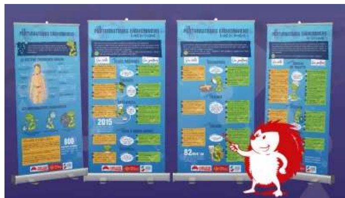
4 roll-up (2x1m) à exposer accompagné de son Livret pédagogique (+12ans)